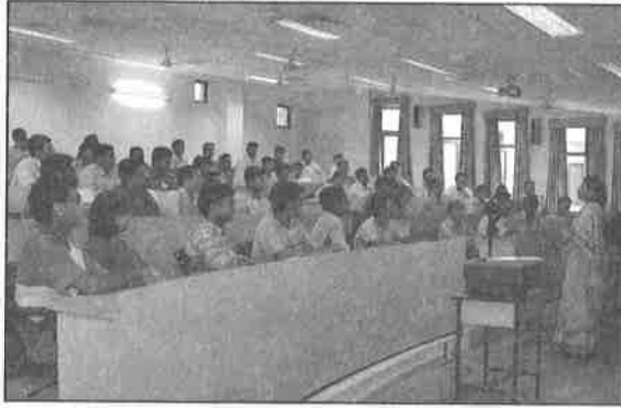
शिक्षण कक्ष Classroom