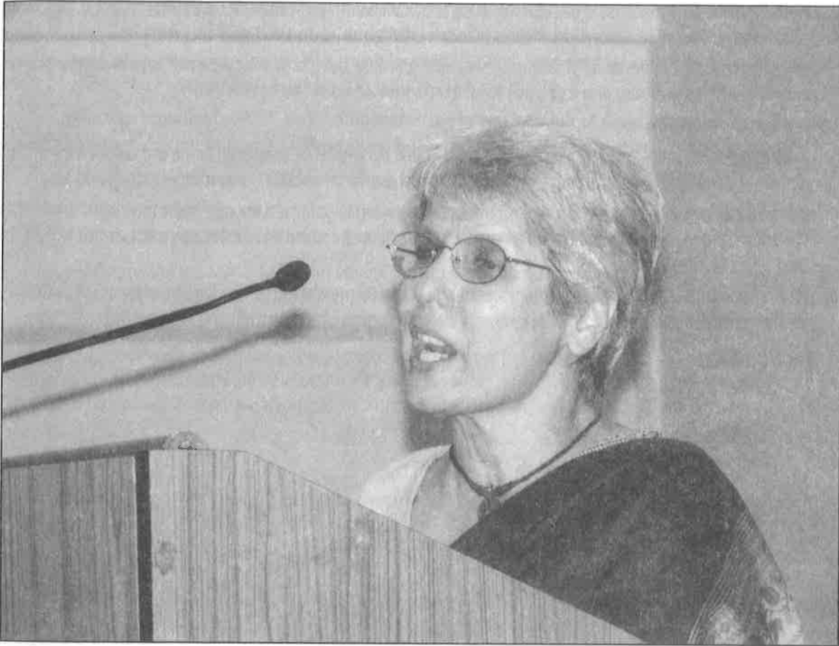
श्रीमती अनु अगा, अध्यक्ष थर्मैक्स लिमिटेड पाँचवें स्थापना दिवस पर व्याख्यान देते हुए Mrs. Anu Aga, Chairperson, Thermax Ltd. Delivering Speech on the Fifth Foundation Day Lecture

The Fifth Foundation Day Lecture of the Institute was held on October 3, 2004. Mrs. Anu Aga, Chairperson, Thermax Ltd., delivered the lecture.