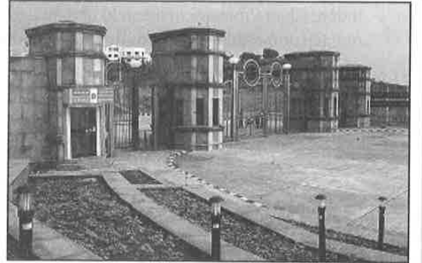
मुख्य द्वार Main Gate