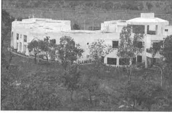
प्रबंध विकास केन्द्र Management Development Centre

प्रशासनिक प्रखण्ड, संकाय प्रखण्ड, शिक्षण कक्षों, ग्रंथालय, कम्प्यूटर केन्द्र, प्रबंधन विकास केन्द्र, संगोष्ठी प्रखण्ड, होस्टल, रसोईघर, भोजनकक्ष व सुविधा प्रखण्डों का निर्माण कार्य के साथ आवश्यक सेवाओं जैसे जल-आपूर्ति, निकासियों, विद्युतीकरण व सड़क निर्माण आदि कार्य पूर्ण हो चुका है। कुल भू-भाग 193.4 एकड़ व कुल निर्मित क्षेत्र 35,000 वर्ग मीटर है।