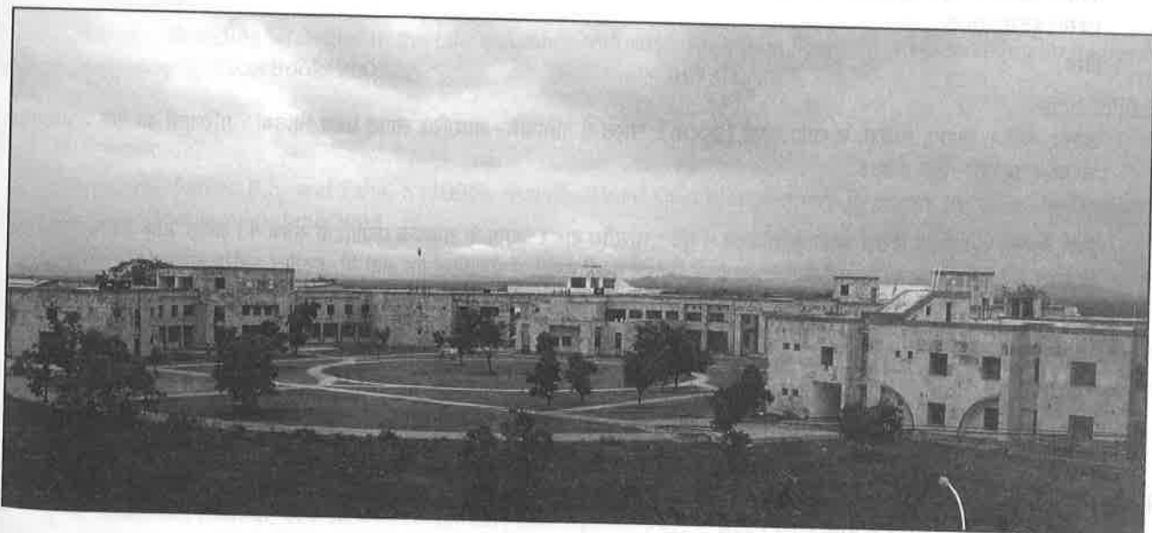
मुख्य भवन अन्दर से Inner circle of the Main Block