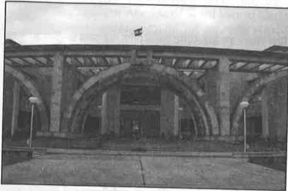
मुख्य भवन का प्रवेश द्वार Entrance to Main Building

The construction of Administrative Block, Faculty Block, Classrooms, Library, Computer Centre, Management Development Centre, Seminar Block, Hostels, Kitchen and Dining and Utility Blocks have already been completed along with essential services like water supply, sewerage, electrification, roads, etc. The total land area is 193.4 acres and the total area constructed is 35000 sq. mtrs.