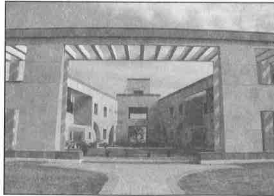
संकाय खण्ड Faculty Block